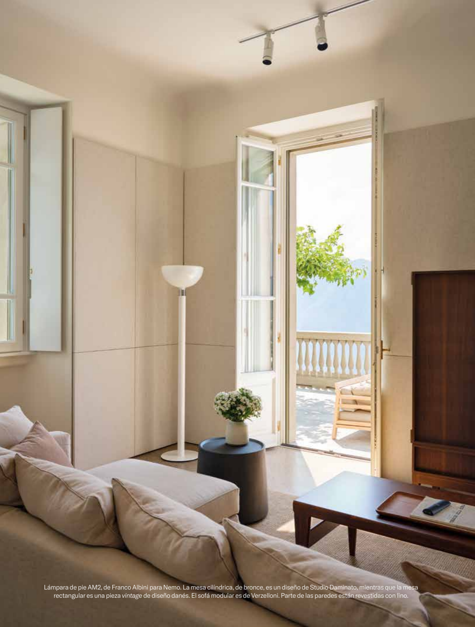
Lámpara de pie AM2, de Franco Albini para Nemo. La mesa cilíndrica, de bronce, es un diseño de Studio Daminato, mientras que la mesa rectangular es una pieza vintage de diseño danés. El sofá modular es de Verzelloni. Parte de las paredes están revestidas con lino.