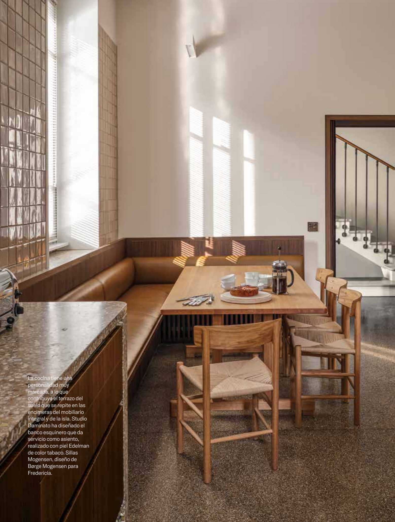
La cocina tiene una personalidad muy marcada, a lo que contribuye el terrazo del suelo que se repite en las encimeras del mobiliario integral y de la isla. Studio Daminato ha diseñado el banco esquinero que da servicio como asiento, realizado con piel Edelman de color tabaco. Sillas Mogensen, diseño de Borge Mogensen para Fredericia.