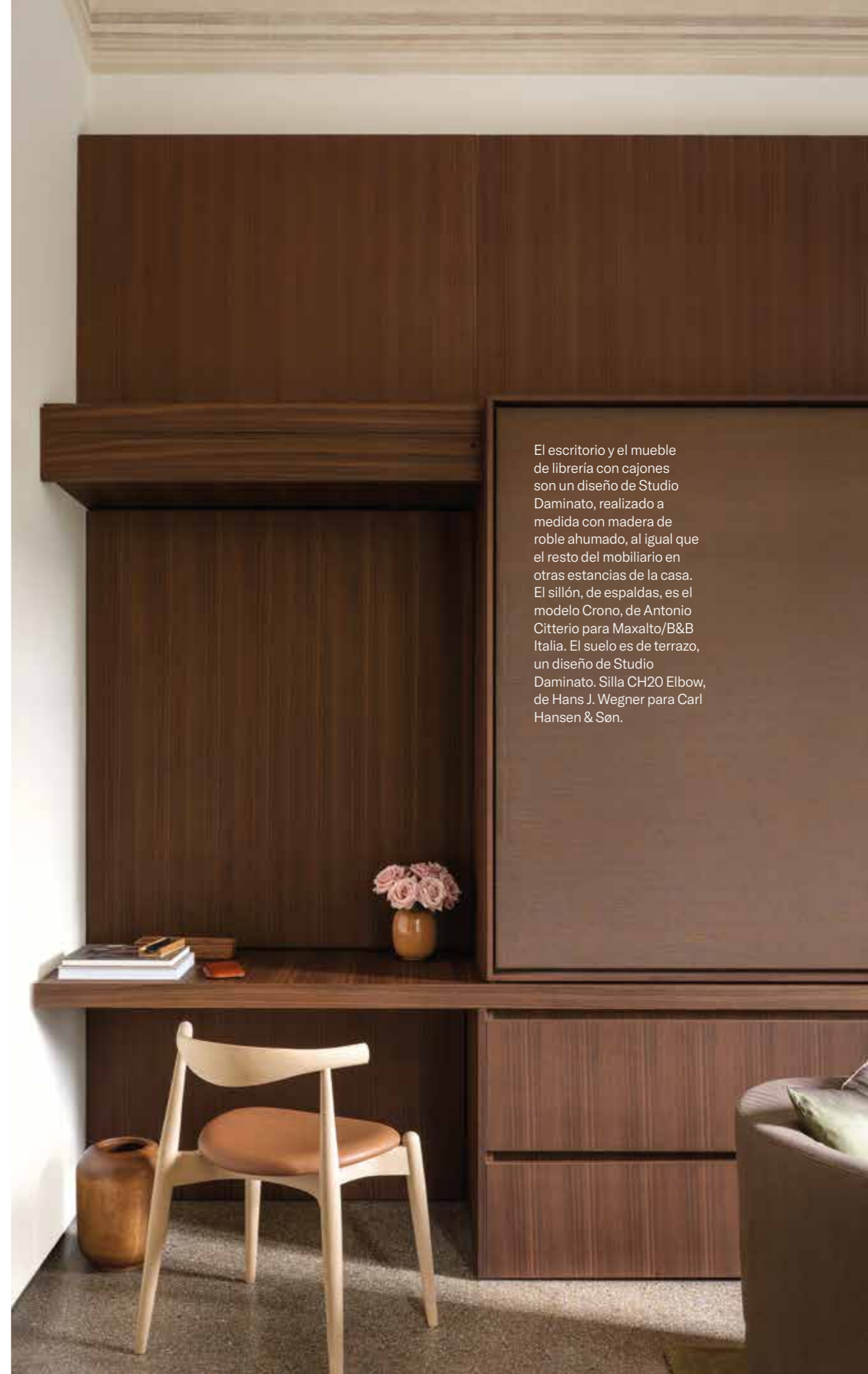
El escritorio y el mueble de librería con cajones son un diseño de Studio Daminato, realizado a medida con madera de roble ahumado, al igual que el resto del mobiliario en otras estancias de la casa. El sillón, de espaldas, es el modelo Crono, de Antonio Citterio para Maxalto/B&B Italia. El suelo es de terrazo, un diseño de Studio Daminato. Silla CH20 Elbow, de Hans J. Wegner para Carl Hansen & Son.