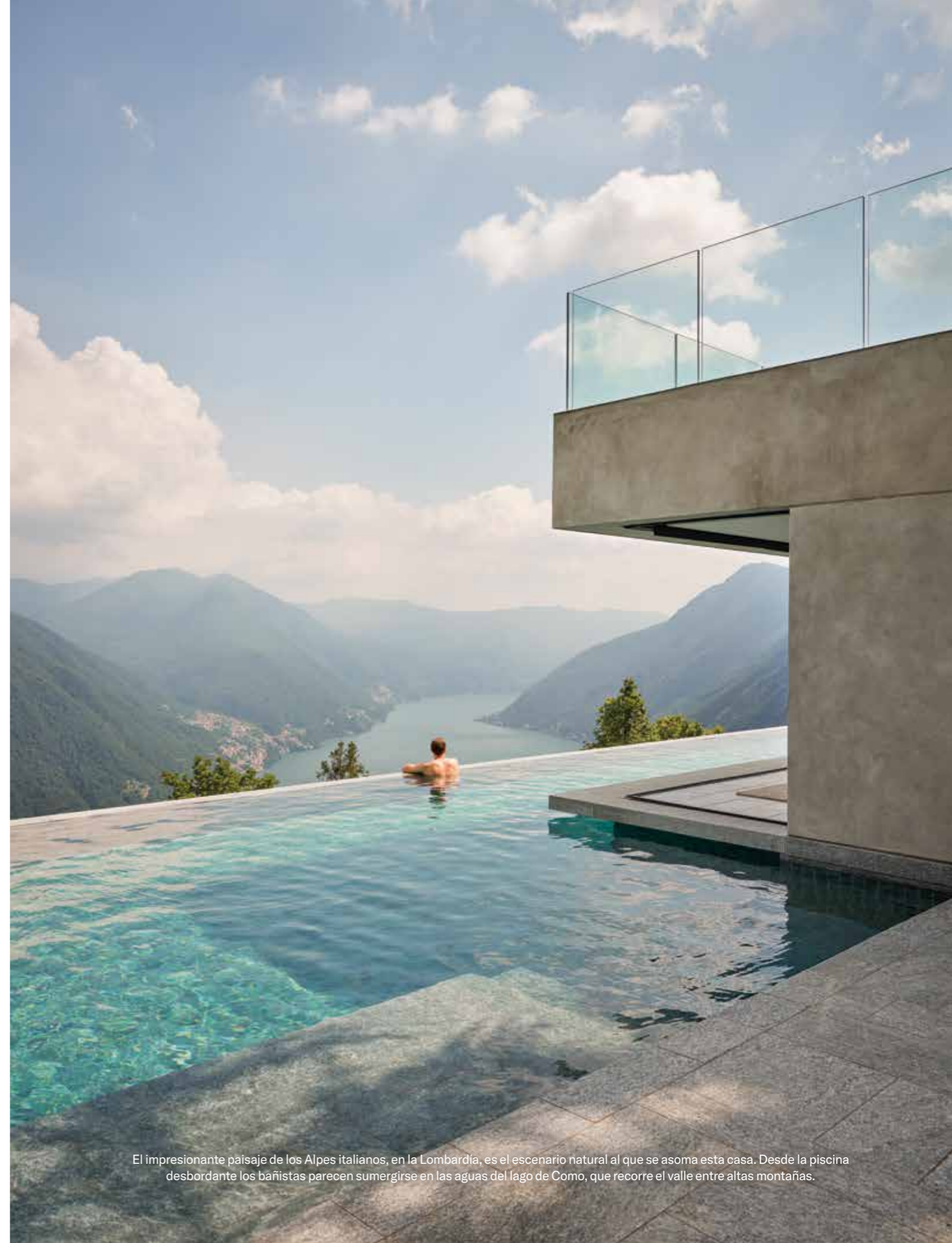
El impresionante paisaje de los Alpes italianos, en la Lombardía, es el escenario natural al que se asoma esta casa. Desde la piscina desbordante los bañistas parecen sumergirse en las aguas del lago de Como, que recorre el valle entre altas montañas.