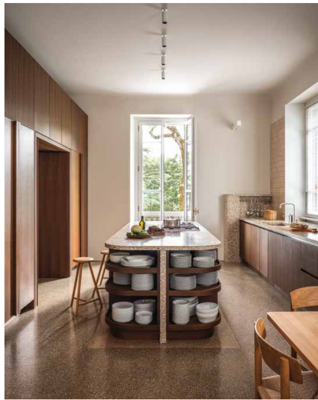
En la cocina, las encimeras son de terrazo hecho a medida. Los armarios también son un diseño a medida acabado con roble ahumado. Taburetes Perch, de Nikari. Las luminarias del techo son las DOT R, de Davide Groppi. Aplique mural, de Viabizzuno.